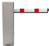
Barreras vehiculares ZKTeco